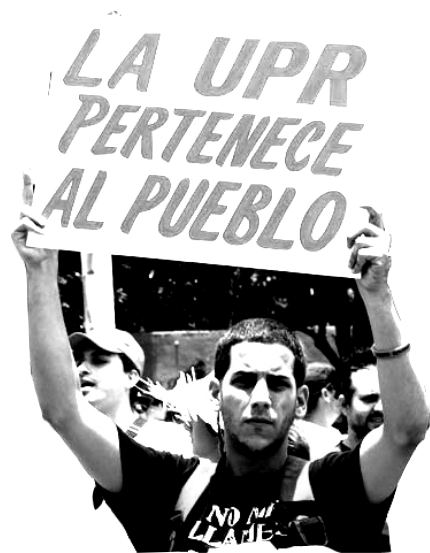
Marcha 18 de julio