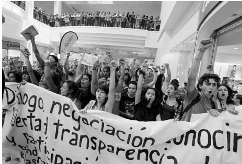
Marcha por Plaza las Américas durante la huelga pasada