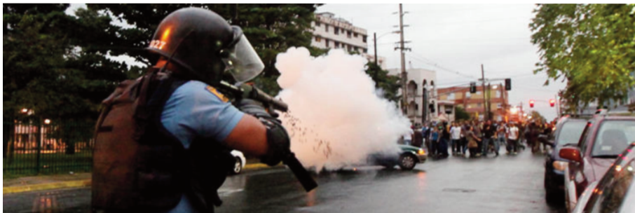
La policía reprimió con dureza las manifestaciones contra la cuota de $800.

6. El discurso de la lucha contra la cuota de $800 dólares se convirtió en una navaja de doble filo, pues mientras era necesario desarrollar la lucha concreta contra la cuota , nuestro discurso movilizador se quedó corto para la magnitud y tamaño de los problemas que se viven en la UPR. Los problemas son más grandes y abarcadores que una cuota o unas exenciones, lo sabíamos, pero nos arrinconamos ideológicamente al economisismo de la cuota, limitando la posibilidad de aglutinar bajo consignas más abarcadoras a cada vez más sectores del estudiantado. Los medios masivos de comunicación ayudaron a arrinconar nuestro mensaje al país, pues somos concientes que hubo elementos de ese discurso amplio que fueron ahogados por los medios. El trabajo independiente del movimiento no enfatizó este aspecto, siendo absorbido luego por el discurso de “fuera la policía” como consigna de transición y de solución. La APPU y la HEEND aportaron a esto último, a limitar