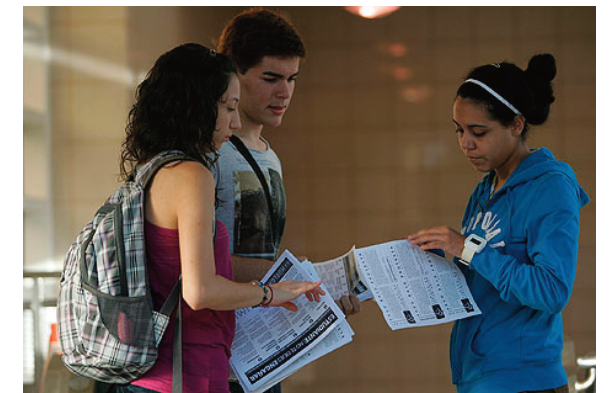
Estudiantes reparten boletines explicando las razones de la lucha.

En “ Teoría leninista de la organización ”, el socialista belga Ernest Mandel explica las relaciones de los diferentes sectores en la lucha política.